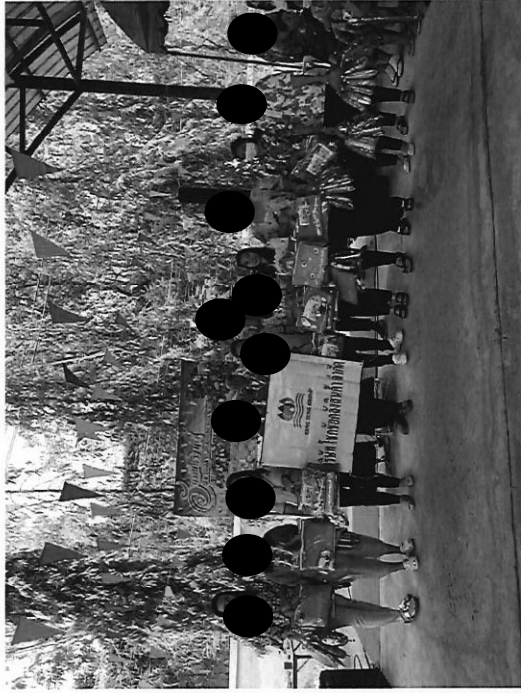
สนับสนุนเพื่อจัดกิจกรรมสงกรานต์ในชุมชนผู้สูงอายุตำบลคลองสะแก ร่วมกับ โรงพยาบาลส่งเสริมสุขภาพตำบลคลองสะแก